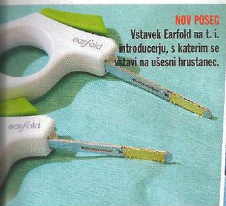
NOV POSEG Vstavek Earfold na t. i. introducerju, s katerim se vstavi na ušesni hrustanec.